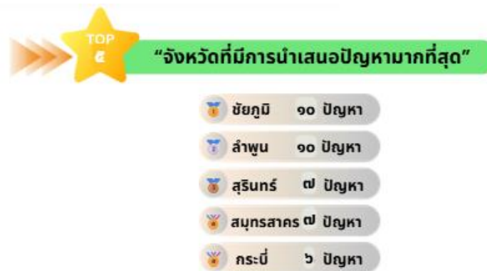
ภาพ Infographic การแยกประเด็นปัญหาตามจังหวัดต่าง ๆ