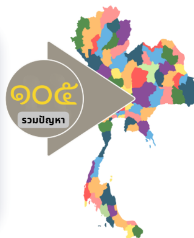
ภาพ Infographic การแยกประเด็นปัญหาตามด้านต่าง ๆ