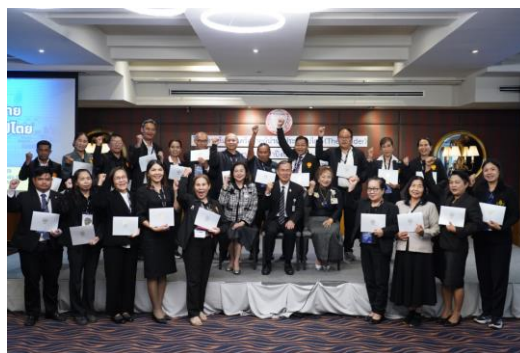
ภาพบรรยากาศโครงการสัมมนาเครือข่ายผู้นำนักประชาธิปไตย (The Leader) ครั้งที่ ๑/๒๕๖๙ ๒.๓ ผลการดำเนินการที่ได้จากการมีส่วนร่วม

การดำเนินโครงการสัมมนาฯ ดังกล่าว ได้ดำเนินกิจกรรมรับฟังความคิดเห็นเกี่ยวกับ “ร่างพระราชบัญญัติ หรือ กฎหมายที่เกี่ยวข้องกับสาขาอาชีพของกลุ่มเป้าหมาย” (ร่างพระราชบัญญัติที่กำลังจะเข้าสู่การพิจารณาของวุฒิสภา หรือ ประเด็นที่อยู่ในความสนใจของประชาชน) : กรณี “ปัญหาสำคัญในพื้นที่ภาคต่าง ๆ ที่เครือข่ายผู้นำนักประชาธิปไตยเห็นควรเสนอให้มีการแก้ไข”